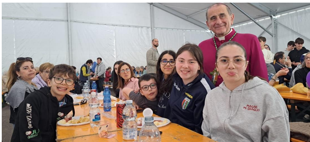
Il gruppo famiglie

Il 1° maggio poi alcune fa- miglie si sono ritrovate an- che all'an- nuale festa del seminario. L'Arcivescovo è passato tra i tavoli salu- tando tutti i presenti.